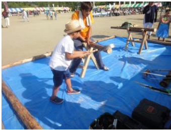
イベント会場では丸太切り体験「キコリンピック」がスタート！