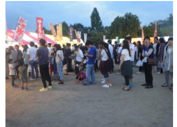
物産・飲食ブースが開店！ 沢山のお客さんと賑わいました。