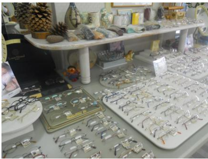
【←種類豊富な眼鏡達】