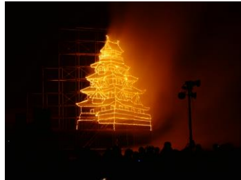
今年も沼田城が仕掛け花火によって蘇りました！