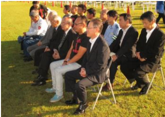
当日早朝花火大会が無事に開催されるよう祈願祭を行いました。