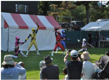
子供達に大人気のニンジャボールが登場！