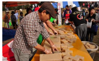
「巨大こんにやく」 切り分けプレゼント!