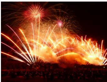
音楽と共に始まった迫力のある花火で会場からは大きな歓声が響きました。