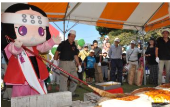
「巨大焼まんじゅう」 切り分けプレゼント!