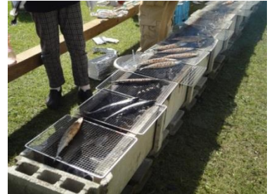
【気仙沼産のサンマ】

9月26日(土)に爽やかな秋晴れの中、「第4回気仙沼支援サンマまつり」が、サラダパークぬまたにて開催されました。当日は沢山のお客様でにぎわい、気仙沼産の美味しい炭火焼きサンマ500匹が販売され、大盛況となりました。また、サラダパークぬまたではレストランや直売所、カフェなどの営業を行っておりますので、足を運んでみてはいかがでしょうか。サラダパークぬまたは12月~3月まで休園となりますのでご注意ください。