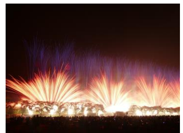
グランドフィナーレは、大迫力で感動的でした。