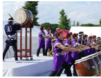
薄根ふるさと太鼓の演奏で会場は盛大に盛り上がりました。