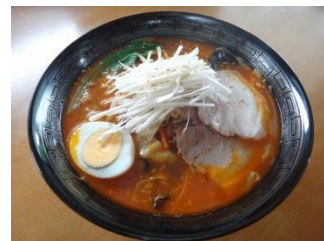
みそオロチョンラーメン

沼田市下久屋町941-2 電話番号 24-4370 営業時間 11:00~22:00 定休日 月曜日(祝の場合翌日)