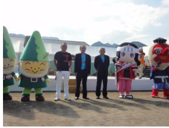
開会式にはゆるキャラも駆けつけてくれました。