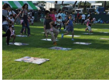
「ジャンボ上毛カルタ大会」では、子供達が元気に走りまわりました。